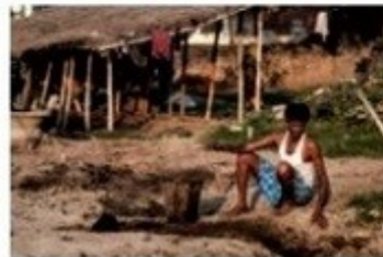
De derde wereld